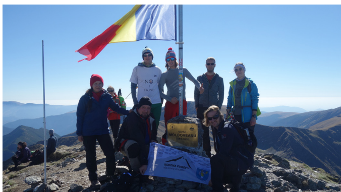
Moldoveanu, najwyższy szczyt Rumunii