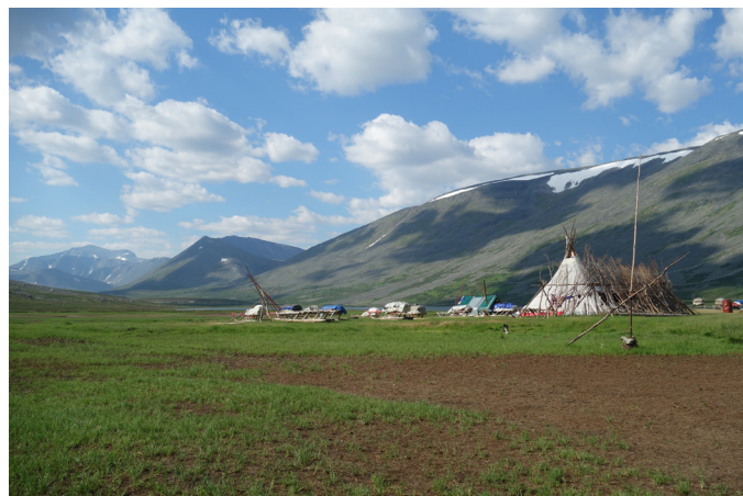
Obóz pasterzy reniferów, czum.