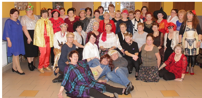
Grono dostojnych uczestniczek Babskiego Combra.

Najważniejszą imprezą karnawałową był tradycyjny Babski Comber, w którym uczestniczyło ponad 40 naszych Pań. W wymyślnych i pięknych kreacjach bawiły się one przednio, przy skocznej muzyce tanecznej, którą serwował nasz DJ Jan Burek.