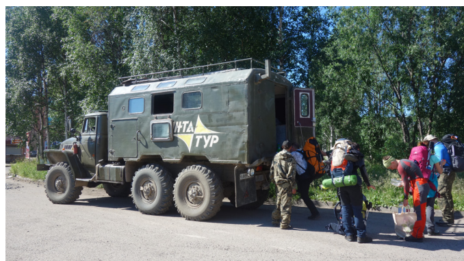
Załadunek sprzętu w Incie, przed nami ok 6h jazdy do Żelannaja czyli miejsca wypadowego na Ural