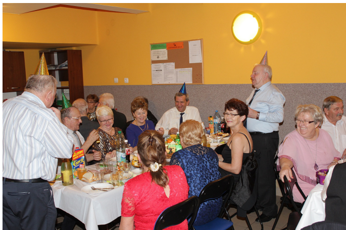
Witamy Nowy Rok 2019!.

Ostatniego grudnia około 40 osobowa naszych członków zakończyła rok 2018 z przytupem na zabawie sylwestrowej. Dopisała nie tylko frekwencja, ale także menu i humory. Uczestnicy wykazali się dużą wytrzymałością fizyczną w tańcach i śpiewach. W Nowy Rok 2019 wszyscy wkroczyli w szampańskim nastroju. Oby nam dopisało zdrowie, a o resztę będziemy zabiegać. Mamy nadzieję, że rok 2019 dla członków naszego Koła pod każdym względem również będzie tak udany jak 2018..