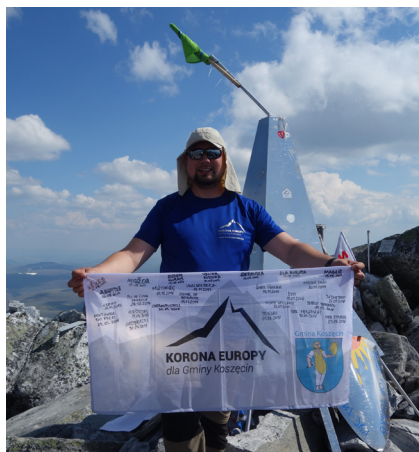
Najwyższy szczyt europejskiej części Rosji, Narodnaja