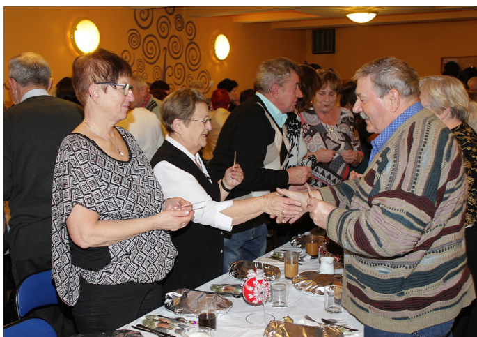
Opłatkowe życzenia bożonarodzeniowe.