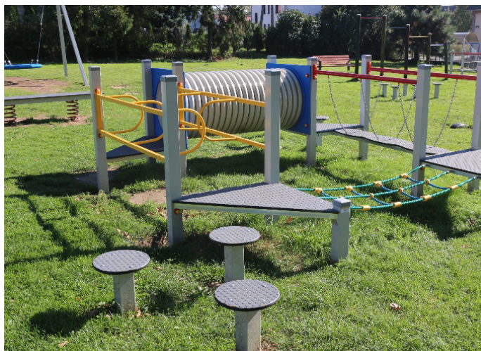
Plac zabaw przy Szkole Podstawowej