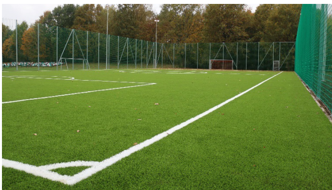
Boisko sportowe w Koszęcinie