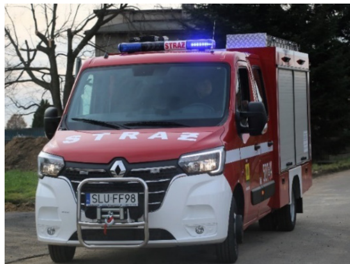
Samochód ratowniczo-gaśniczy dla OSP Wierzbie