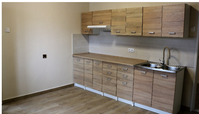
Wyremontowane pomieszczenie w Spichlerzu