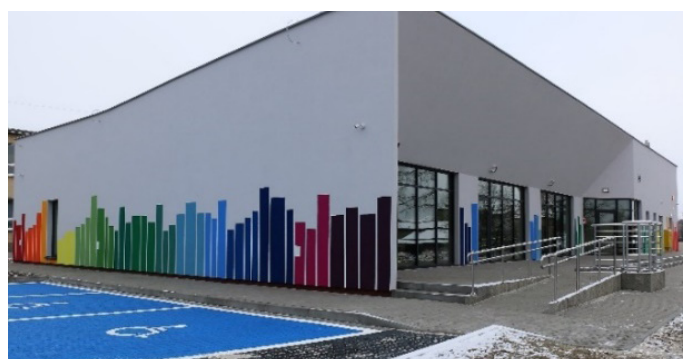
Przedszkole w Rusinowicach