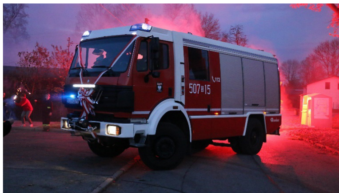
Samochód ratowniczo-gaśniczy dla OSP Cieszowa