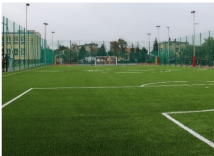
Boisko przy Szkole Podstawowej