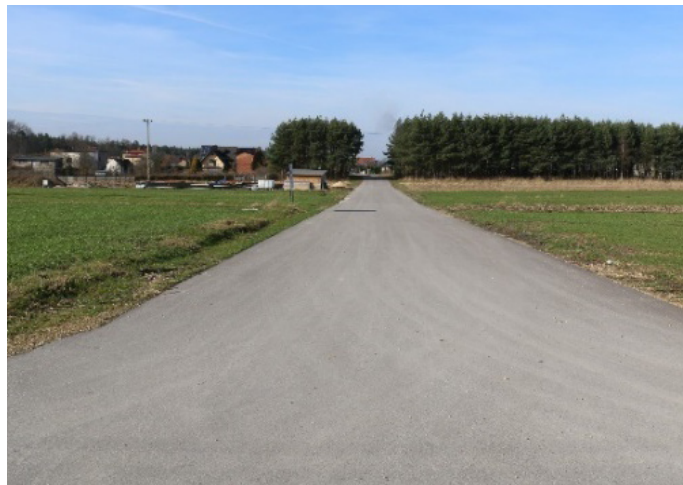
ul. Długa w Strzebinu