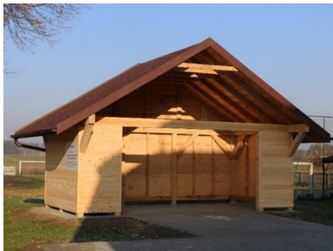
Wiata w Wierzbiu