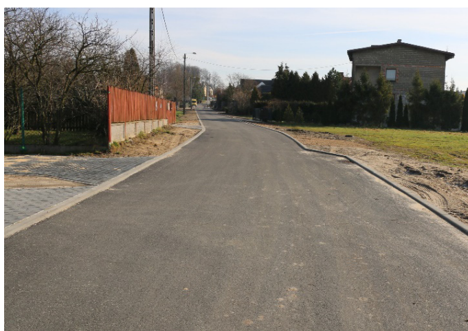
ul. Mieszka I w Koszęcinie