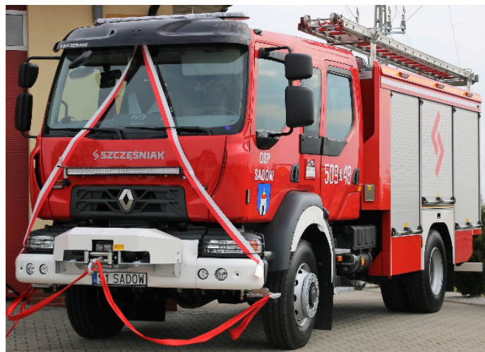
Pojazd ratowniczo-gaśniczy dla OSP Sadów

7. Montaż skrzynki elektrycznej przy budynku wielofunkcyjnym