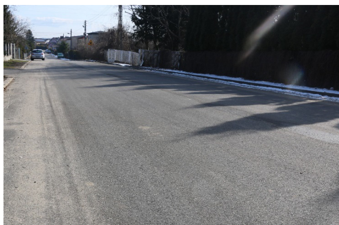
ul. Śląska w Koszęcinie