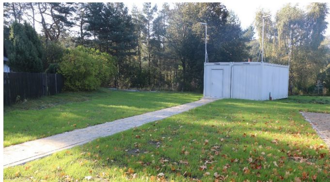
Świetlica spotkań wiejskich