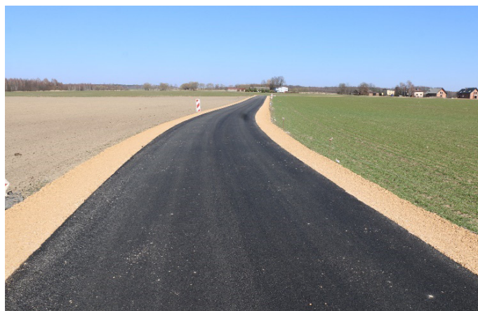
Droga w Irkach